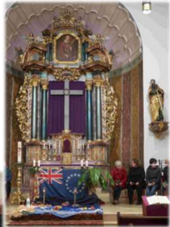
Den Gottesdienst zum Weltgebetstag 2026 bereiten Christinnen aus Nigeria vor.